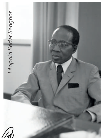
Léopold Sédar Senghor

Inscriptions : 06 60 38 86 37 ou 06 45 25 73 49 ou 06 98 53 70 73