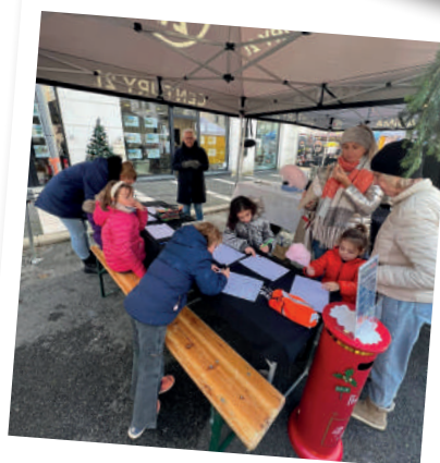
@Century 21 Kadima, pour l'association des commerçants lors du marché de Noël

Magazine d'informations municipales de la ville de Saint-Médard-en-Jalles Directeur de la publication : Stéphane Delpéyrat-Vincent Édition JANVIER - FÉVRIER 2024 Rédaction et design graphique : direction de la Communication Photos : direction de la Communication, Bordeaux métropole, JB Menges (couverture, p.1, p.15, p.16, p.17) Imprimerie : BLF