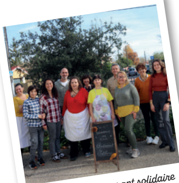
L'équipe du Restaurant solidaire vous accueille bientôt !

Renseignements : 05 56 05 54 38 ou rpa@saint-medard-en-jalles.fr