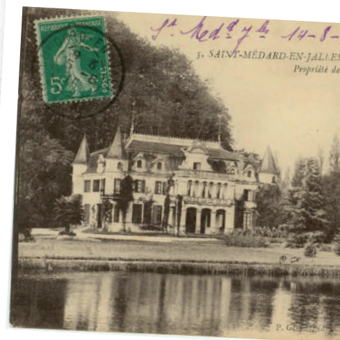
Le château La Fon, carte postale envoyée en 1915