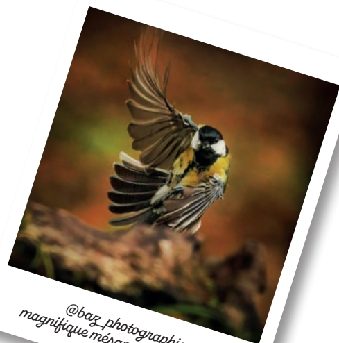
@baz_photographie, magnifique mésange charbonnière