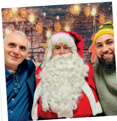
@Escale des possibles, Noël à Magudas !