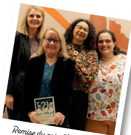
Remise du prix "Agenda 21" le 7 décembre 2023