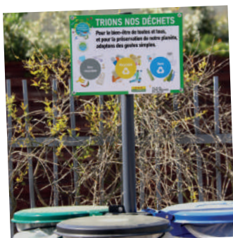
Les poubelles de tri mises en place dans la ville