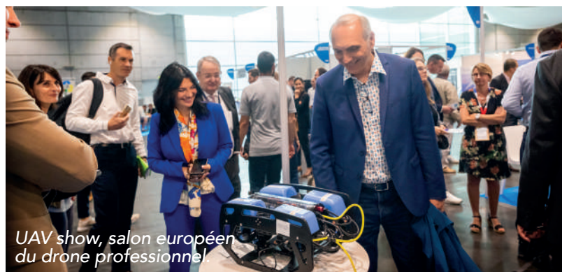
UAV show, salon européen du drone professionnel

Les zones d'activités économiques Galaxie, le rond point de Feydit, le site Catherineau, la forêt Drolin les secteurs d'activités le long des avenues Pagnot, Mazeau et Touban, mais aussi les 3 sites d'Ariane group (Issac, Saint-Médard Centre et Candale).