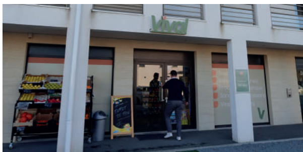
La supérette Vival fête ses 1 an !