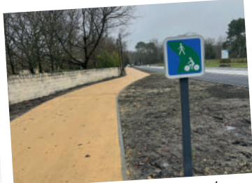
Les travaux de la voie verte de Capeyron sont terminés !

La première ligne du plan vélo de la Ville reliant Picot au rond point de Capeyron intègre une voie verte désormais ouverte à la circulation. La particularité des voies vertes est d'être aménagée le long des voiries, décrochées de la chaussée et réservées aux piétons et vélos.