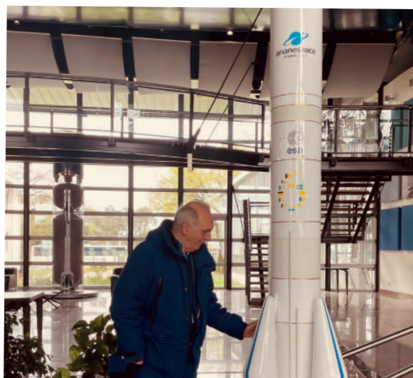
Le vol inaugural d'Ariane 6 est attendu à l'été 2024... l'Histoire continue !

Dans les années 60 , la production sert un plan de dissuasion porté par le Général de Gaulle : dès lors, la production se concentre sur le carburant qui alimente les missiles de la force nucléaire stratégique. Le virage vers la production de « propergols » combustible destiné aux propulseurs est amorcé.