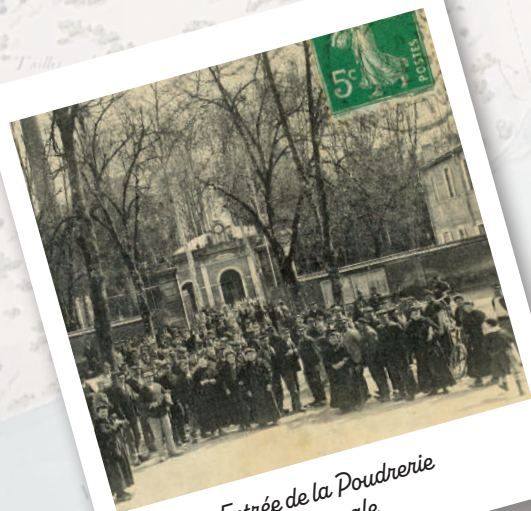
Entrée de la Poudrerie nationale

En avril 1944 un bombardement allié, secrètement orchestré avec la participation d'ouvriers - résistants français, permet de limiter la production de la poudrerie et participe ainsi à la victoire des troupes alliées.