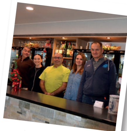
L'équipe de la brasserie