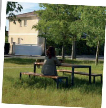
Table de pique-nique