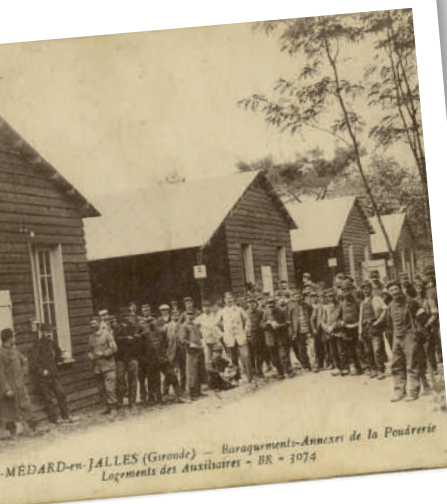
Cantonement annexe de la poudrerie

En 1971 , la poudrerie devient SNPE et poursuit la stratégie d'armement de la France inscrite dans son ADN depuis plus de 300 ans.