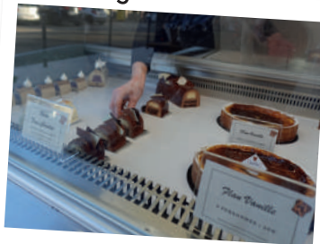
Keik : votre nouvelle pâtisserie

Une nouvelle pâtisserie à ouverte à Hastignan : 74, rue Alexis Puyo.