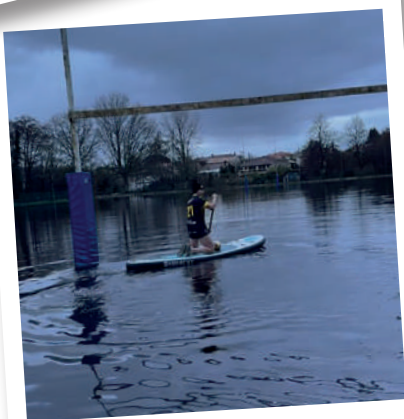
le @SMRC à la découverte d'un nouveau sport ?