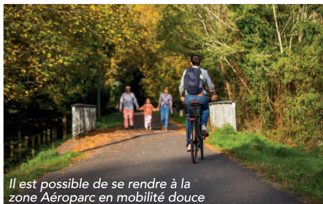
Il est possible de se rendre à la zone Aéroparc en mobilité douce